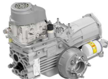
FERRARI 380 HY StarGate