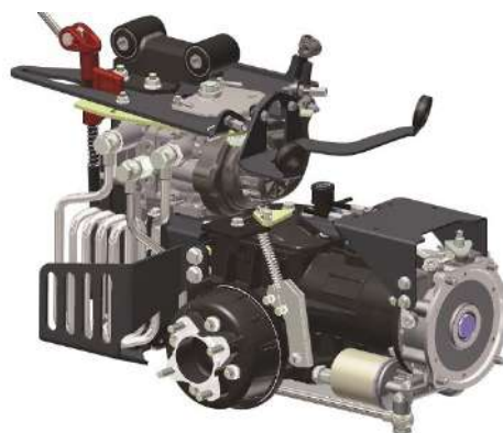
FERRARI 370 HY PowerSafe®