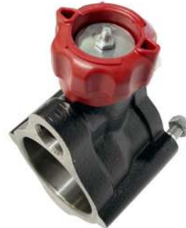
Til 360 og 560