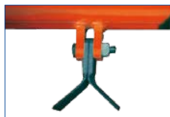
COLTELLI Y (universali) "Y" knives (universal) Couteaux à "Y" (universels) "Y" Messer (universal)