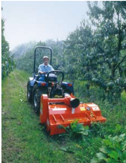
MT22 al lavoro con attacco frontale MT22 at work with front hitch MT22 au travail avec l'application frontale MT22 an die Arbeit bei der Frontanbau-Version