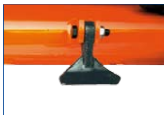
MAZZE Hammer Marteaux Hämmer