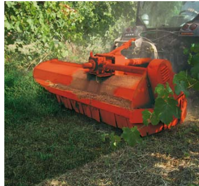
MT23 al lavoro con attacco frontale MT23 at work with front hitch MT23 au travail avec l'application frontale MT23 an die Arbeit bei der Frontanbau-Version