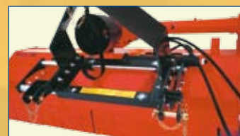
MT 22 SV

Versione con attacco scorrevole Version with side shifting Version avec attelage déplaçable Version mit Seitenverstellung