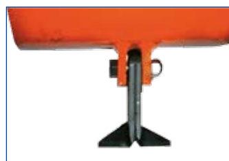
COLTELLI "T" (specifici per erba) "T" knives (special for grass) Couteaux à "T" (spécifiques pour herbe) "T" Messer (spezifisch für Gras)